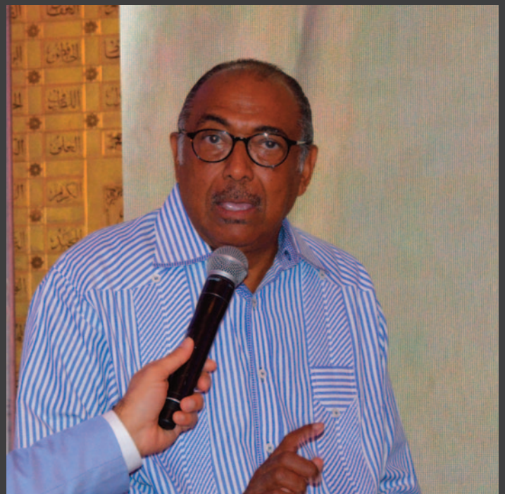
D r Michel Sidibe 8